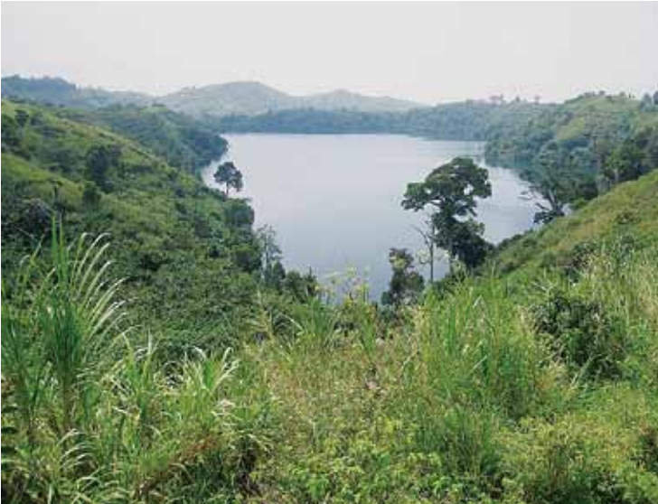
Figur 2. Kratersjö SO om Fort Portal. Foto: Staffan Rosell 2012.

har inkluderat ett team som skött boende och mathållning åt gruppen, samt ett antal fältguider som också agerat tolkar åt studenterna. Under ankomstdagen har kursledarna hållit en introduktion till uppgiften som studenterna ska genomföra under vistelsen på landsbygden, samt gjort en kortare genomgång av GPS:er och andra enk-